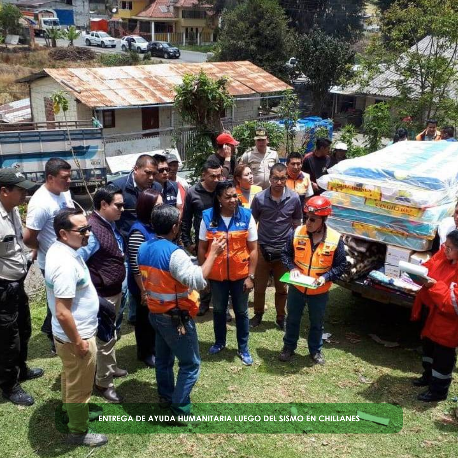
ENTREGA DE AYUDA HUMANITARIA LUEGO DEL SISMO EN CHILLANES