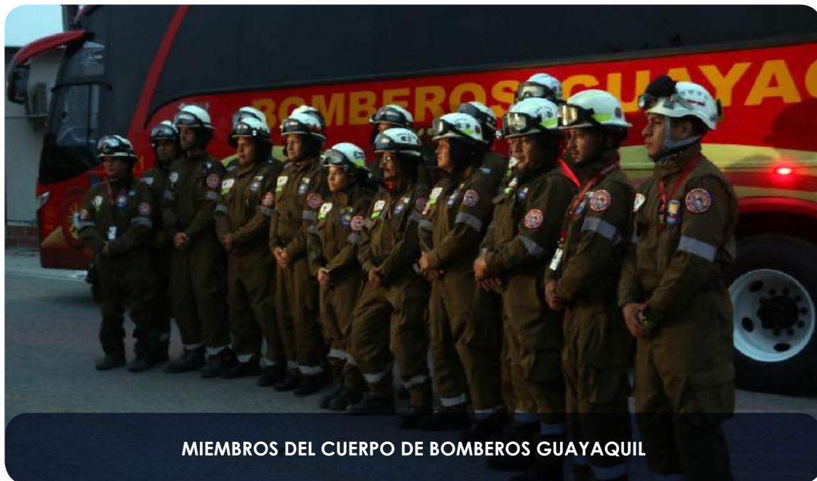
MIEMBROS DEL CUERPO DE BOMBEROS GUAYAQUIL

garantiza la toma de decisiones adecuadas y oportunas para la consecución de sus objetivos propuestos, la eficiencia de los procesos de planificación continua, la optimización de recursos y la respuesta frente a riesgos y preocupaciones evidenciadas para el horizonte planificado.