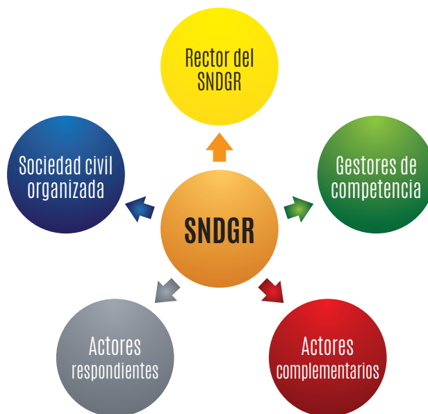
Figura 1. Actores del Sistema Nacional descentralizado de Gestión de Riesgos