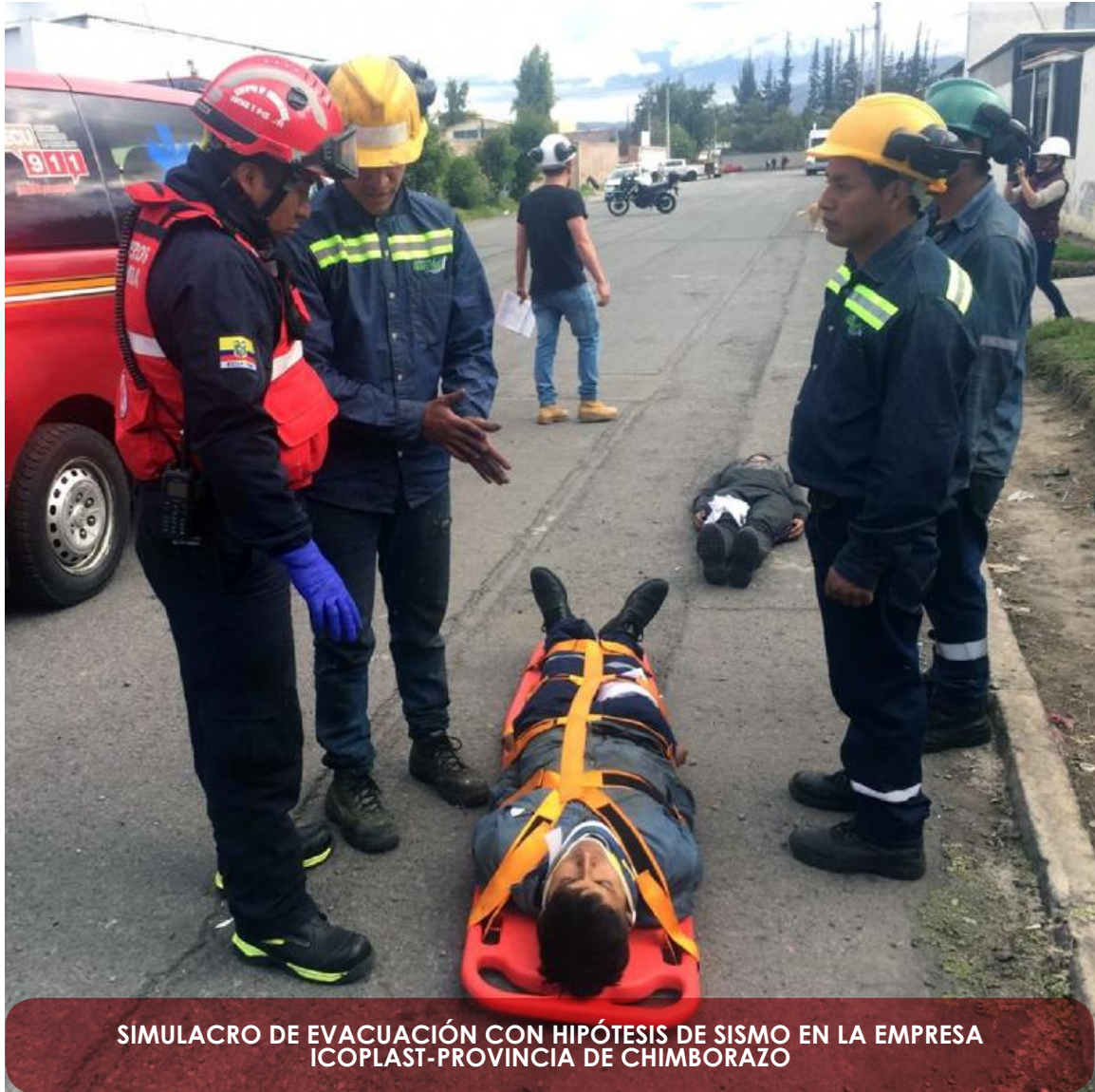
SIMULACRO DE EVACUACIÓN CON HIPÓTESIS DE SISMO EN LA EMPRESA ICOPLAST-PROVINCIA DE CHIMBORAZO