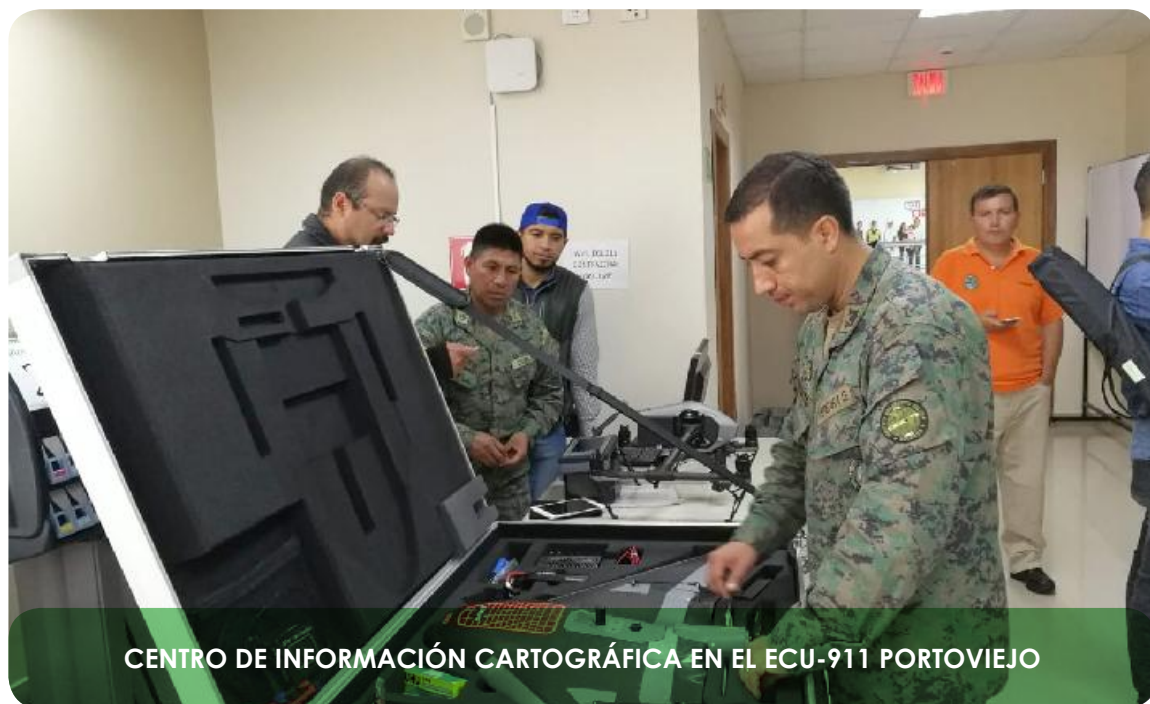
CENTRO DE INFORMACIÓN CARTOGRÁFICA EN EL ECU-911 PORTOVIEJO

de la gestión de riesgos, además de existir otros mecanismos de alerta como los SMS que se envían ante la inminente ocurrencia de un evento peligroso a la población dentro de un área de influencia específica, como los sistemas de alerta comunitarios. Sin embargo, es necesario fortalecer este proceso en términos de cobertura y regulaciones para establecer el uso tecnologías como estándares de televisión digital (EWBS) y cell broadcast (CBS), debido a que existen poblaciones altamente vulnerables que requieren de la urgencia de ser alertadas cuando existe alta probabilidad de ocurrencia de un evento peligroso, así como la necesidad de articular los diferentes sistemas y mecanismos existentes en un sistema nacional de alerta temprana.