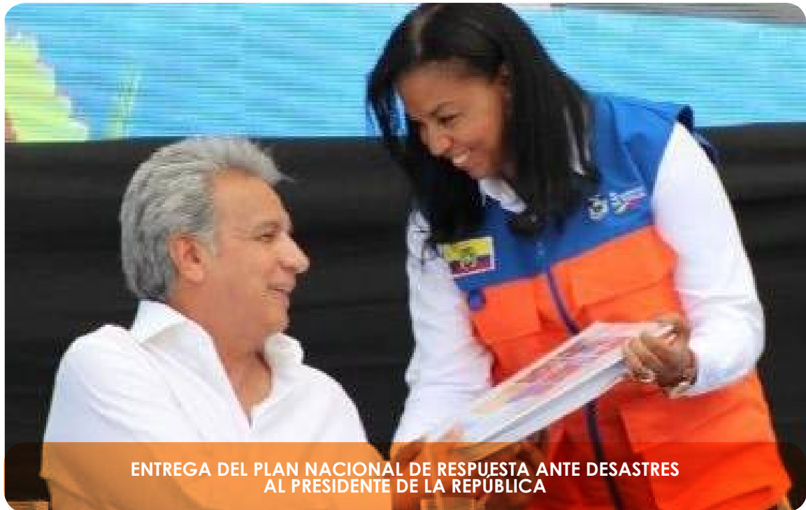
ENTREGA DEL PLAN NACIONAL DE RESPUESTA ANTE DESASTRES AL PRESIDENTE DE LA REPUBLICA

El ciclo de la gestión de riesgos de desastres debe entenderse de manera integral, ya que un adecuado análisis de riesgos y reducción de los mismos, permitirá mejorar la preparación ante desastres para una respuesta eficaz y mejorar los procesos de recuperación procurando reconstruir mejor . Basados en la prioridad 4 del Marco de Sendai, del que el Ecuador es Estado parte.