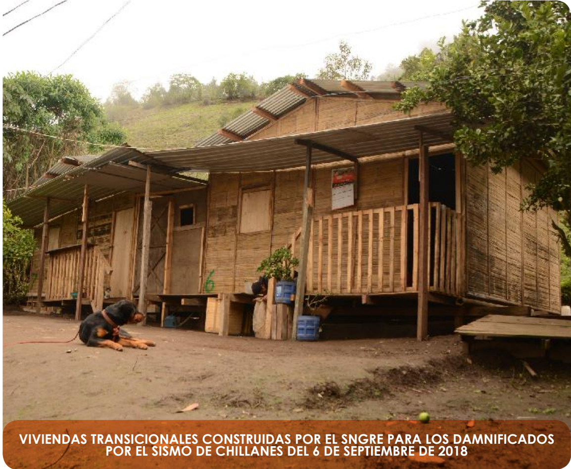
VIVIENDAS TRANSICIONALES CONSTRUIDAS POR EL SNGRE PARA LOS DAMNIFICADOS POR EL SISMO DE CHILLANES DEL 6 DE SEPTIEMBRE DE 2018

servicios, viviendas, instalaciones y medios de vida necesarios para el pleno funcionamiento de una comunidad o sociedad afectada por un desastre, siguiendo los principios del desarrollo sostenible y de reconstruir mejor , con el fin de evitar o reducir el riesgo de desastres en el futuro y garantizando no reconstruir el riesgo .