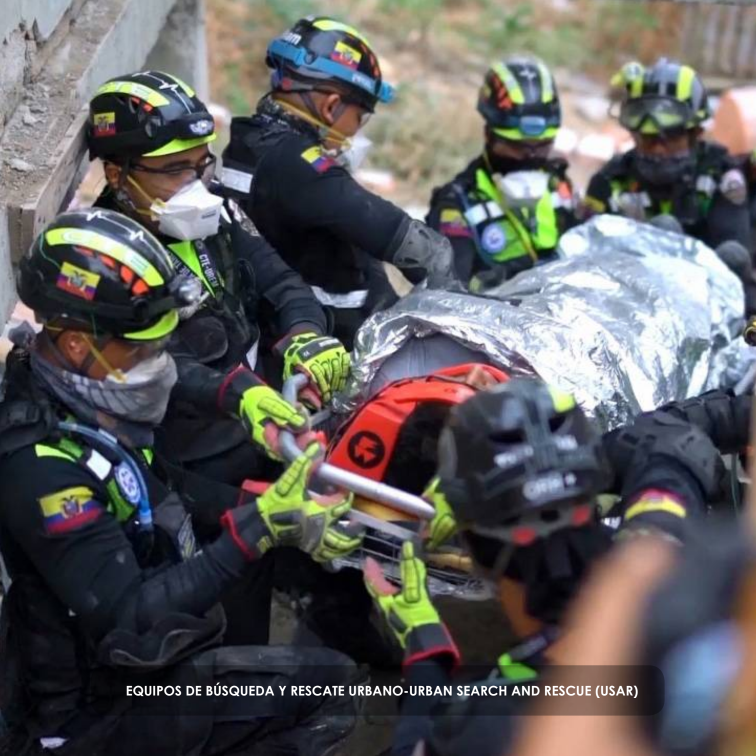
EQUIPOS DE BÚSQUEDA Y RESCATE URBANO-URBAN SEARCH AND RESCUE (USAR)