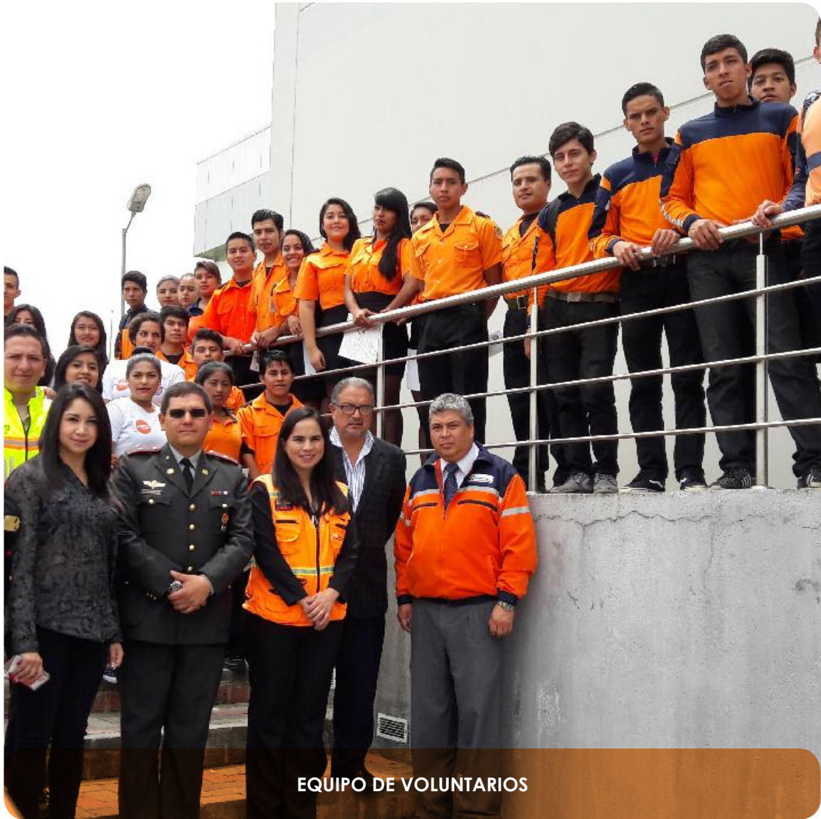
EQUIPO DE VOLUNTARIOS