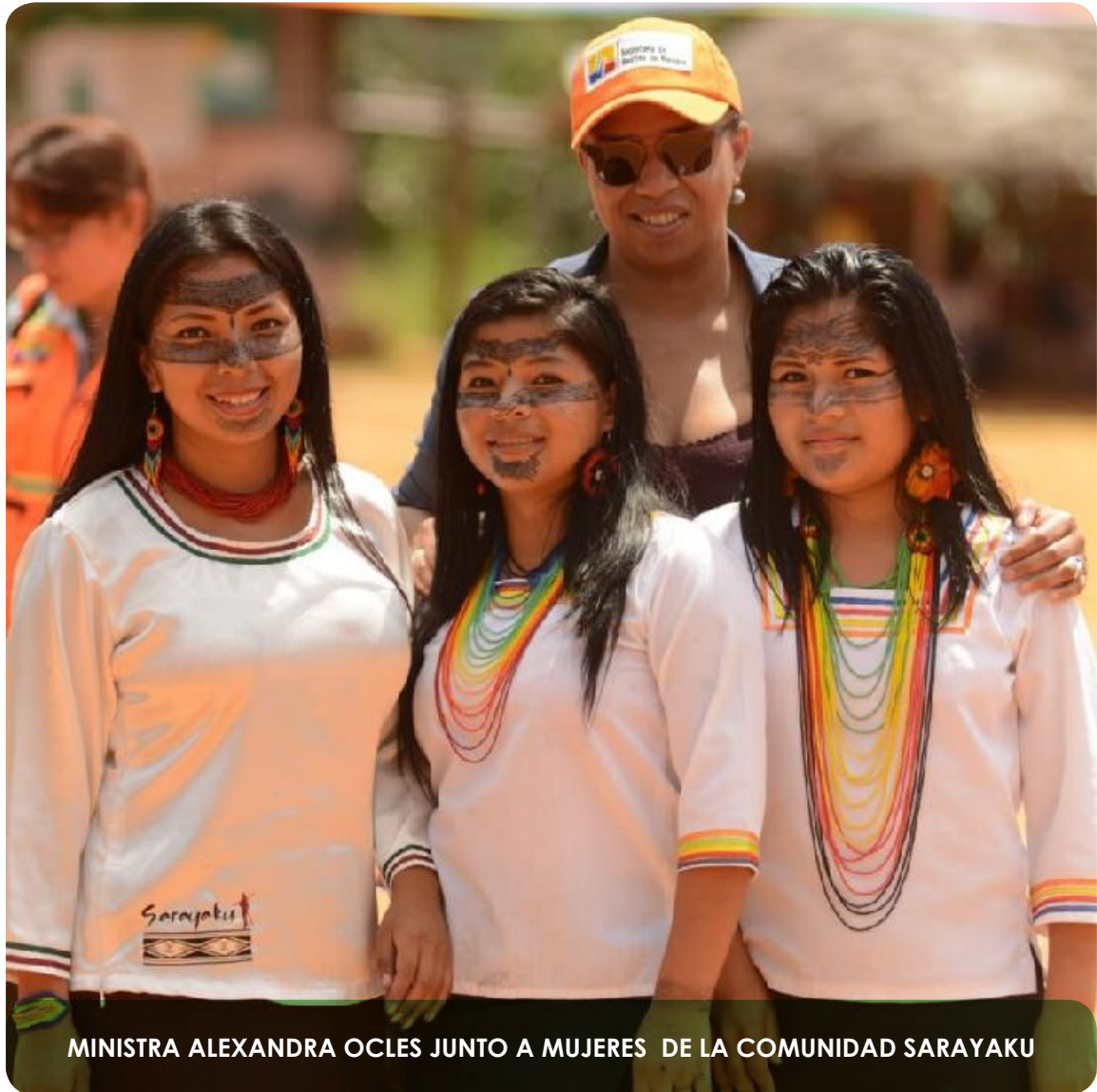
MINISTRA ALEXANDRA OCLES JUNTO A MUJERES DE LA COMUNIDAD SARAYAKU