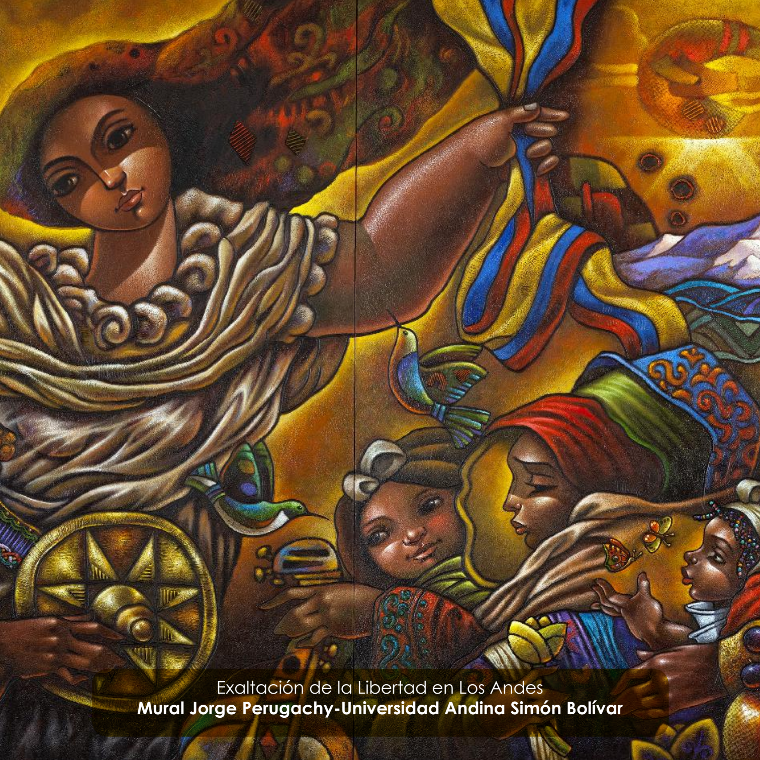
Exaltación de la Libertad en Los Andes Mural Jorge Perugachy-Universidad Andina Simón Bolívar