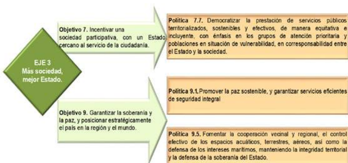
Gráfico N.º2: Ejes, objetivos y políticas del PND 2017-2021 a los que se alinea el sector defensa

Fuente: Agenda de Coordinación Intersectorial de Seguridad 2017-2021