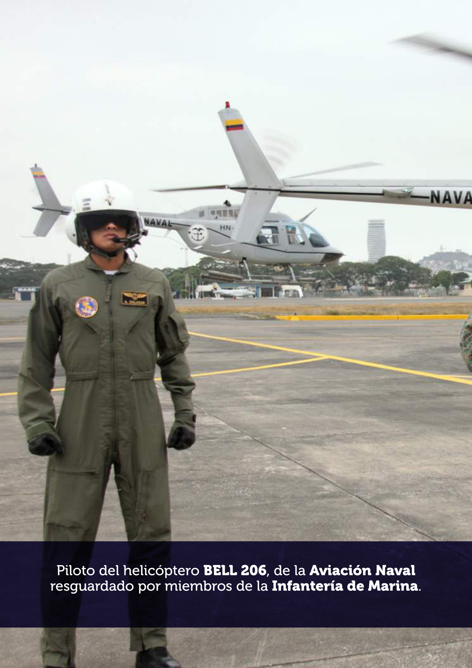
Piloto del helicóptero BELL 206 , de la Aviación Naval resguardado por miembros de la Infantería de Marina .