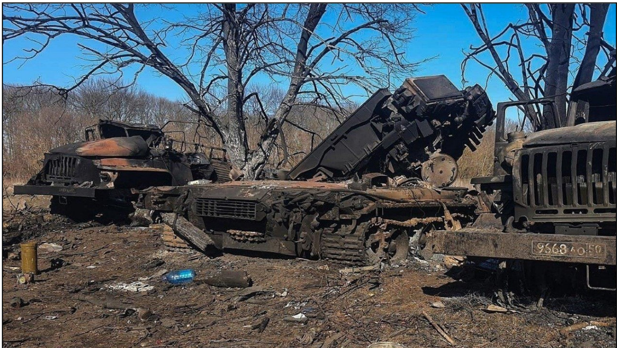
Figura 1. Tanque ruso junto a vehículos logísticos de abastecimiento destruidos por misiles antitanque en territorio ucraniano.

“el Ejército ruso es muy adecuado para campañas cortas y de alta intensidad definidas por un uso intensivo de artillería. Por el contrario, está mal diseñado para una ocupación sostenida, o una guerra de desgaste, que requeriría una gran parte de las fuerzas terrestres de Rusia, que es exactamente el conflicto en el que se ha encontrado. El Ejército ruso no tiene los números disponibles para ajustar fácilmente o rotar fuerzas si una cantidad sustancial de poder de combate se ata en una guerra. Su gran suposición era que, en caso de una crisis con la OTAN, el liderazgo político autorizaría la movilización para elevar los niveles de dotación y reforzar las unidades con personal proveniente de la reserva.” (Lee, 2022)