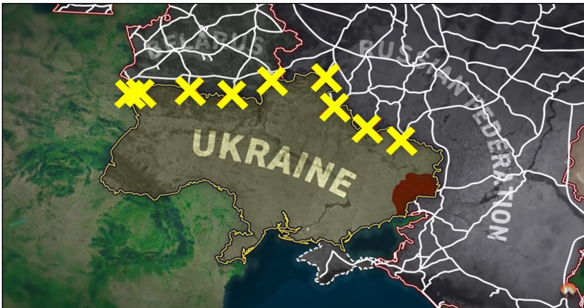
Figura 5. Puntos de contacto ferroviario y de carreteras destruidos por el Ejército ucraniano en Feb. 2022