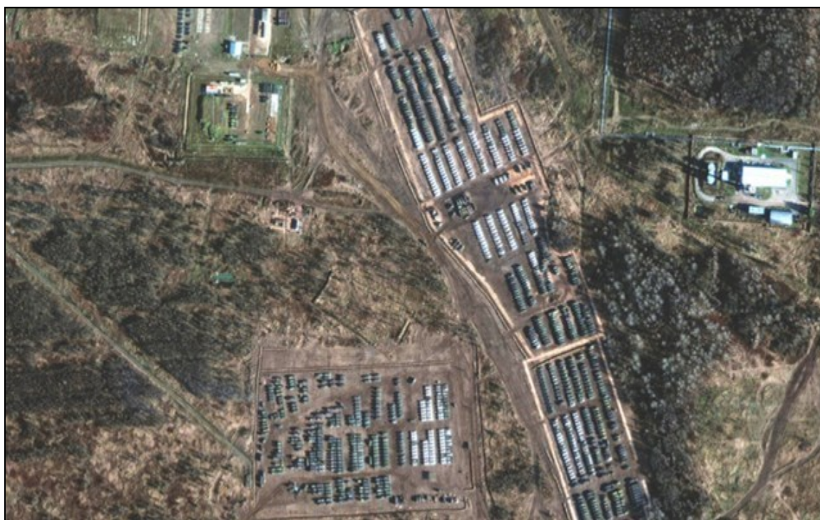
Figura 3. Concentración de medios logísticos del Ejército ruso en la localidad de Yelnya, próxima a la frontera con Ucrania en noviembre de 2021.