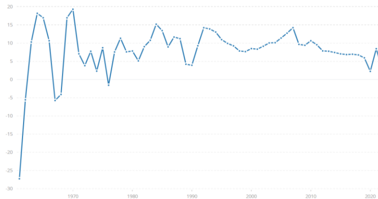
Figura 1. Crecimiento del PIB (% anual) en China.

Dicho crecimiento del capitalismo desde una base socialista se ha conseguido gracias, tanto a un desarrollo interno, como a su entrada en las cadenas de valor a nivel global, provocando así una dependencia e interdependencia en el escenario internacional 5 .