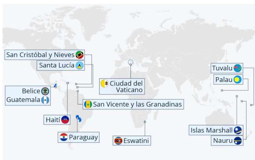
Figura 3. Países que mantenían relaciones diplomáticas con Taiwán en abril de 2023. 20

comunicación latinoamericanos, y sufragando intercambios culturales, turísticos y deportivos. En este alarde de diplomacia cultural, han sido claves los Institutos Confucio, expandidos por la región desde 2006, que ya cuentan hoy con 41 sedes en toda la zona 18 . En último término, ese pensamiento de propagar la cultura y el poder blando también está ligado a la idea de juntar apoyos para aislar a Taiwán y para conseguir reconocimiento de “una sola China”. De hecho, es destacable que hoy en día solo 5 países en la región reconocen aun a Taiwán 19 .