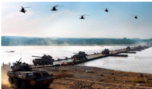
Vehículos militares cruzan un puente de pontones el 19 de octubre de 2010 durante el ejercicio conjunto transregional Mission Action 2010 en China. Treinta mil efectivos de los comandos militares del Ejército Popular de Liberación de Pekín, Chengdu y Lanzhou participaron en el ejercicio en varios lugares.

Las últimas décadas de operaciones de CT y COIN en Afganistán, Iraq y otros lugares han sido testigos de un tipo de guerra muy específico. Los académicos y periodistas han tratado exhaustivamente los retos que plantea la lucha contra actores estatales en organización informal que seden entre la población y luchan de forma asimétrica 16 . Muchos desafíos atrajeron el escrutinio público tanto del derecho de la guerra como de las ROE.