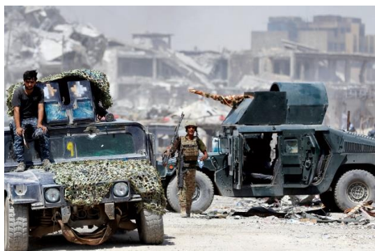
Las fuerzas de seguridad iraquíes con sus armas el 6 de julio de 2017 durante los combates entre las fuerzas iraquíes y los militantes del Estado Islámico en la Ciudad Vieja de Mosul, Iraq.

En particular, estas organizaciones no piden que se modifique la ley en sí. Más bien, el CICR y otras organizaciones piden que se adopten «buenas prácticas» y una nueva «política» 39 . Sin embargo, al pedir una nueva política permanente y abogar por la adopción de una declaración política, los defensores humanitarios están, de hecho, sentando las bases para que el derecho internacional se inmiscuya en lo que siempre ha sido un conjunto de limitaciones política específica a las operaciones. Sin una aclaración deliberada y sostenida, la política madurará en la práctica estatal, y la aceptación en una declaración política podría llegar a ser vista por muchos como una expresión de obligación legal, la misma opinio juris por la que la mera práctica estatal se acepta como derecho internacional vinculante. Además, la política propuesta por el CICR da la vuelta a la norma de las LOAC. A diferencia de las normas de las LOAC, que se formaron y negociaron con la aportación de los militares para no interferir en la conducción de la guerra, la propuesta política restringe explícitamente a los comandantes de las opciones militares permitidas por las LOAC al imponer un más alto en la decisión de usar un arma válida.