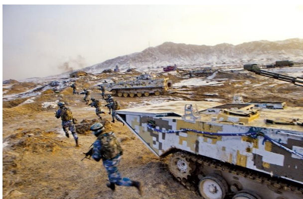
Miembros del Cuerpo de Infantería de Marina del Ejército Popular de Liberación se entrenan en una base de entrenamiento militar el 21 de enero de 2016 en Bayingol, Región Autónoma de Xinjiang Uighur, China. Para derrotar a grandes formaciones adversarias apoyadas por aviones, fuegos de largo alcance y guerra electrónica / cibernética, los comandantes deben conocer y aplicar las leyes del conflicto armado junto con reglas de enfrentamiento adaptadas a la misión.

Sin embargo, las ventajas de las que han disfrutado las fuerzas de EUA y la coalición han recibido bastante menos atención: operaciones lanzadas desde bases en gran medida seguras, con comunicaciones, transportes y suministros seguros y fiables. Superioridad técnica. Armamento de precisión. Suficiente mano de obra. Poca o ninguna amenaza significativa para la patria. El control del aire y de los mares.